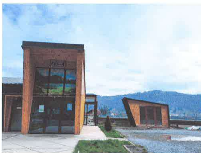
Slika 3: Novoizgrađena Suvenirnica pored Info centra

U toku su završne pripreme za otvaranje prve suvenirnice u Mojkovcu. Na osnovu Programa podsticajnih mjera u oblasti turizma za 2022. godinu, Javnog poziva za podnošenje zahtjeva za dobijanje podrške za projekte iz oblasti turizma za 2022. godinu Mjera IV – Razvoj inovativnih turističkih proizvoda i usluga koji obogaćuju turističku ponudu Crne Gore uvođenjem novih proizvoda, usluga i sadržaja u ruralnom, kulturnom, zdravstvenom, sportskom i drugim vidovima turizma. Ministarstvo ekonomskog razvoja podržalo je projekat Turističke organizacije Mojkovac “Kuća suvenira” sredstvima u iznosu od 4.000,00 eura.